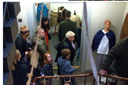
Der var travlt !!